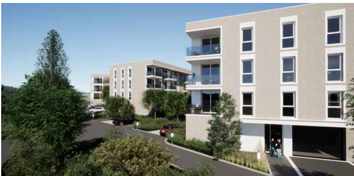
Symbolfoto: So in etwa könnte die Wohnanlage „Neumarkt Mitte“ strukturiert sein.