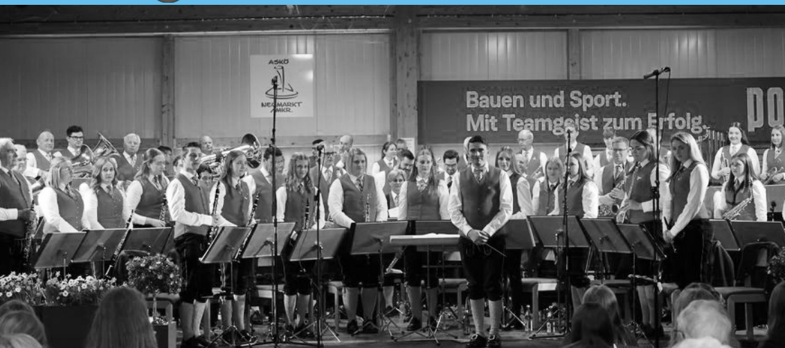
Fr 24. Jubiläumskonzert Musikverein